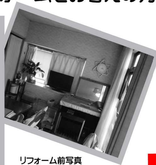
リフォーム前写真